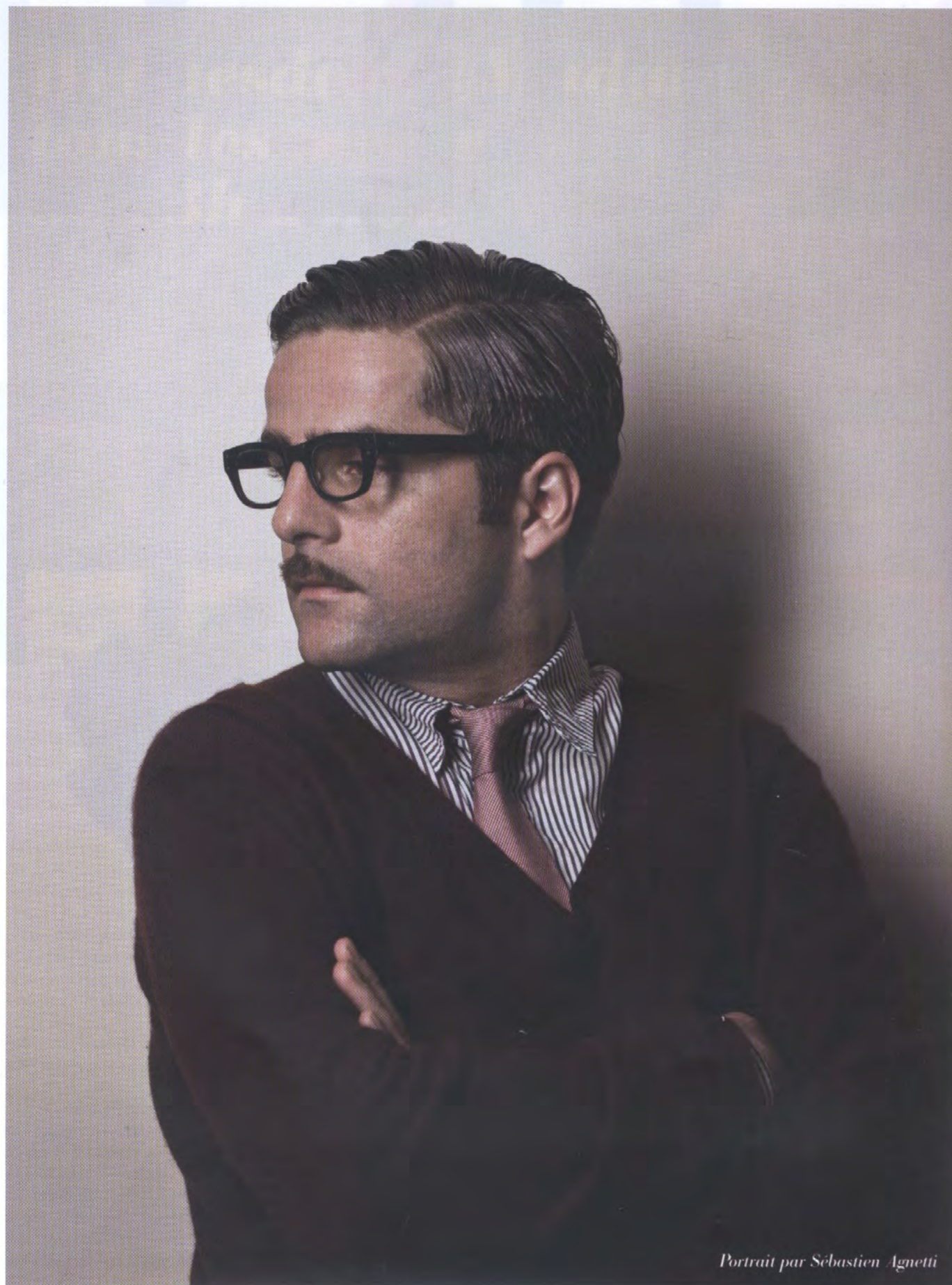
Portrait par Sébastien Agnetti